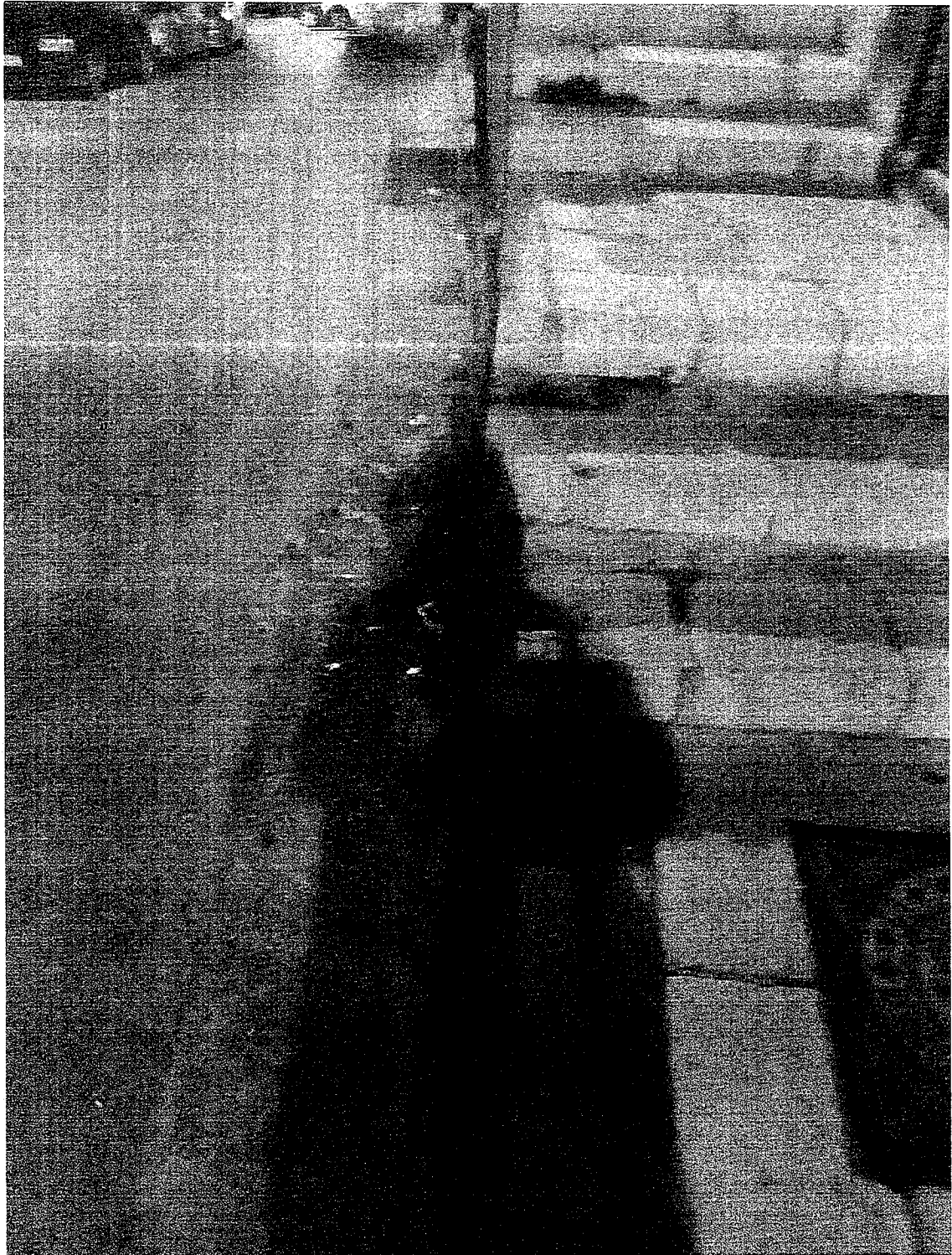
Ringhiera divelta a causa di un incidente con intervento dei vigili urbani tra Natale e Capodanno 2025