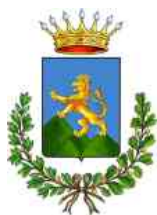
COMUNE DI SCICLI