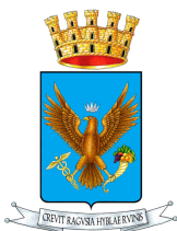
COMUNE DI RAGUSA