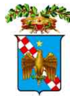
LIBERO CONSORZIO RAGUSA